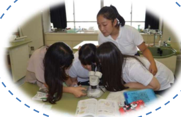
授業でのひとこま