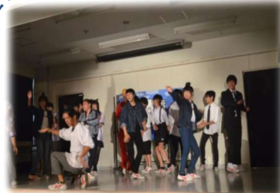
演劇やダンス発表など 文化祭