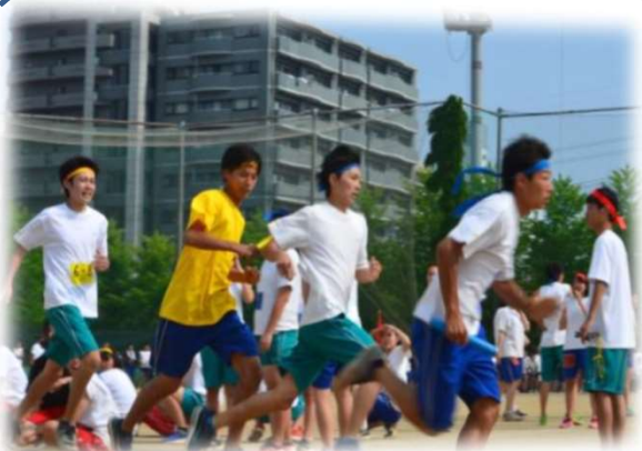
熱戦が繰り広げられる体育祭